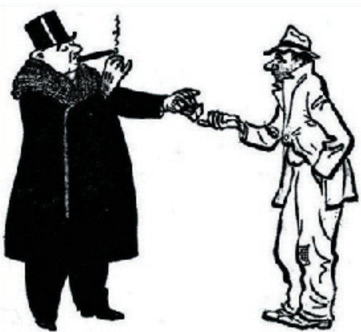
- Классы? Социальные противоречия? Это все выдумки анархистов, смутьянов и космополитов. Мы же с тобой принадлежим к одной нации, к одному этносу!

В свое время анархисты взяли на вооружение эсперанто, чтобы сделать из языка всего лишь средство общения, а не инструмент для делания политики. И CNT, когда она была сильна, не участвовала в языковых кампаниях, целью которых было “создание родины”. Вот почему анархисты, издавна и до сего времени, не имели ни малейшего отношения к этим