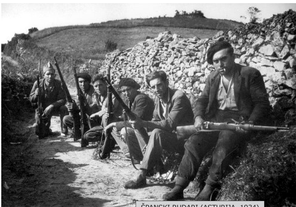
ŠPANSKI RUDARI (ASTURIJA, 1934)

Zato su nam posebno značile reakcije ljudi na koje smo nailazili prilikom uličnih distribuiranja našeg biltena. Najiskrenije i najlucidnije kritike naših članaka, ali i najzanimljivije teme za razmišljanje i pisanje novih tekstova dobijali smo upravo u tim kratkim razgovorima s ljudima koji rano izjutra, vođeni ekonomskom prinudom, odlaze u zagušljiva i mračna grotla kapitalističkog izrabljivanja. Nakon nekoliko nedelja, neki od njih su nas već prepoznavali na ulici, prilazili nam i tražili primerak, i još „nekoliko pride“, da mogu da ponesu na posao i podele kolegama. Dobro pamtimo čoveka koji radi u pošti, ženu koja, iako teško bolesna, preživljava radeći na uličnoj tezgi, bageristu koji radi u jednoj građevinskoj firmi i vozača koji je trubio sirenom tražeći