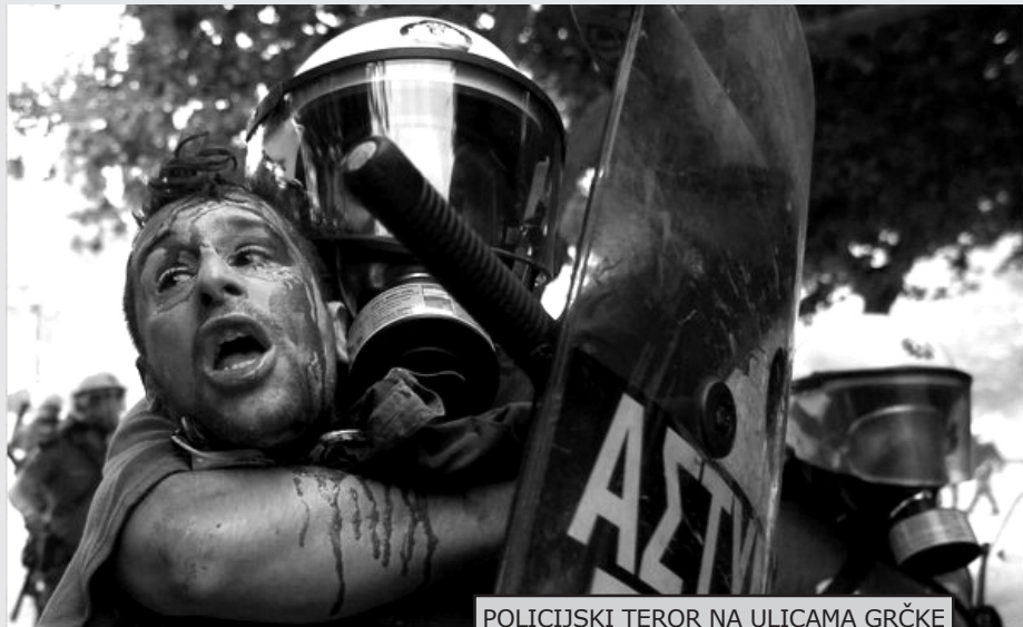
POLICIJSKI TEROR NA ULICAMA GRČKE

Situacija u Grčkoj vrlo lako može da eskalira ne samo u građanski rat, nego i u opšti klasni rat čije se razmere ne mogu predvideti.